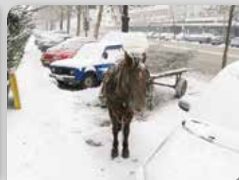
И коњи паркирају, зар не?