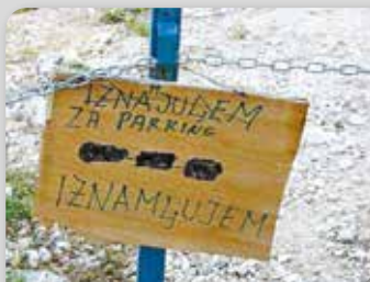
Негујмо српски језик