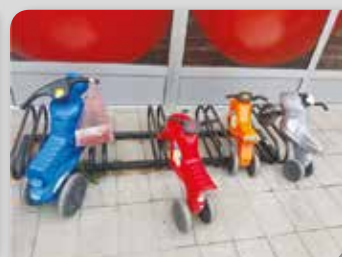
Резервисано за опасне момке