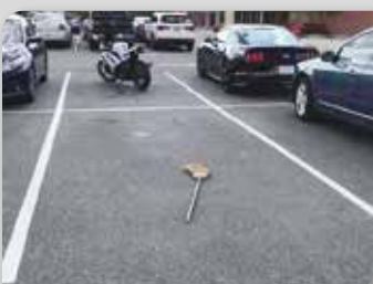
Паркинг за вештице