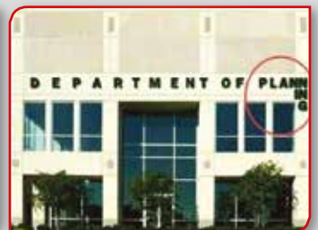
Министарство за планирање