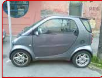
Мали, али техничар