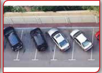
Линије су линије, ал' ред је ред