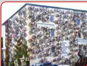
Продавница и сервис за бицикле (Берлин)