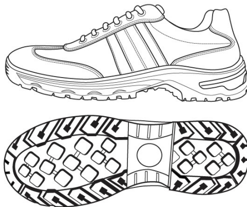
Слика 2 - Спољни изглед патике плитке-летње ципеле

Изглед патике је приказан на слици бр.2: