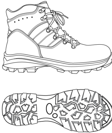
Слика 1 – Спољни изглед дубоке ципеле зимске

Изглед ципеле је приказан на слици бр.1: